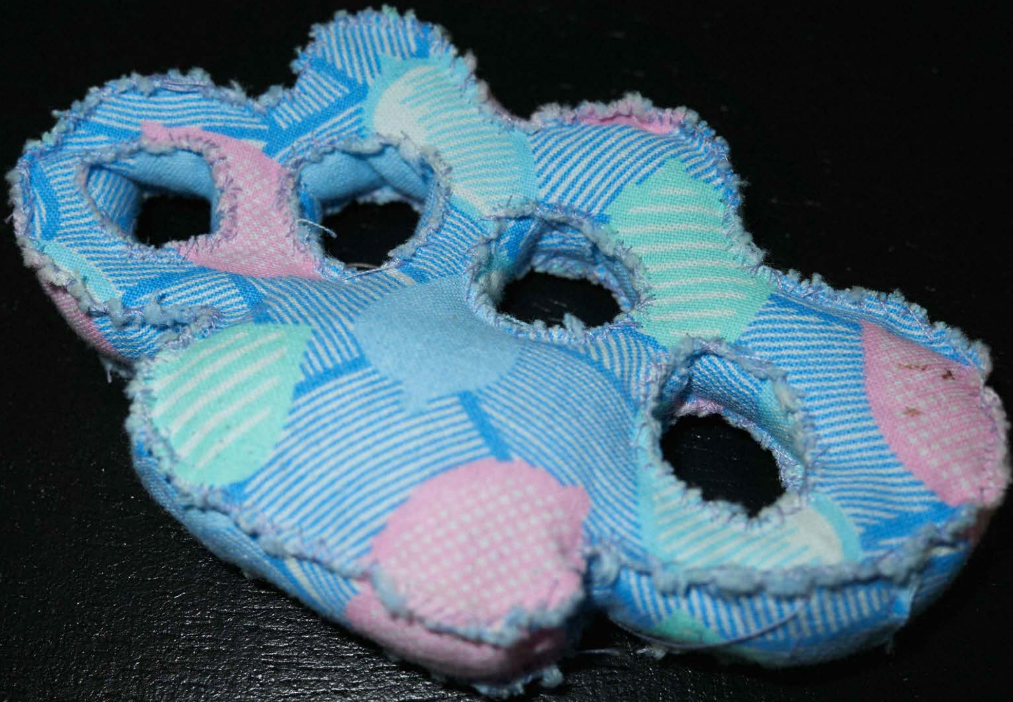
TOUCH IT ON THE SURFACE (2022) ca. 15 x 8 x 2cm, Stoff, Garn, Füllmaterial